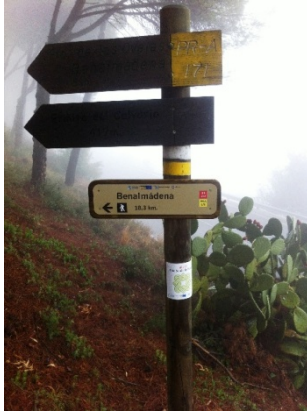
WPT1. Inicio de sendero y de coincidencia con GR 249 Etapa 32 y 33 y con GR 92 E-12 Etapa Ojén – Mijas y Mijas – Benalmádena