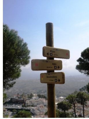
WPT2. Fin de coincidencia con GR 249 Etapa 32 y GR 92 E-12 Etapa Ojén – Mijas