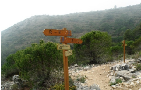
WPT5. Fin de coincidencia 2 con GR 249 Etapa 33 y GR 92 E-12 Etapa Mijas – Benalmádena e inicio de coincidencia con GR 249 Etapa 34 y GR 92 E-12 Etapa Benalmádena – Alhaurín de la Torre