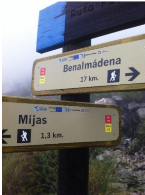
WPT3. Fin de coincidencia con GR 249 Etapa 33 y GR 92 E-12 Etapa Mijas - Benalmádena