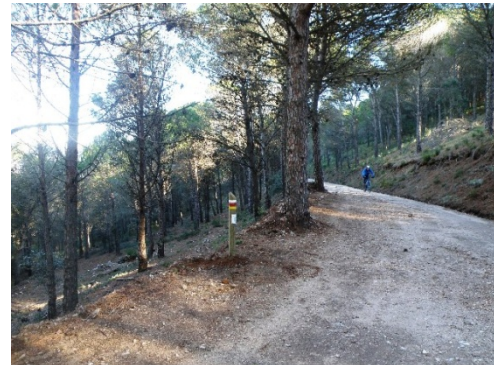
WPT4. Inicio de coincidencia 2 con GR 249 Etapa 33 y GR 92 E-12 Etapa Mijas - Benalmádena