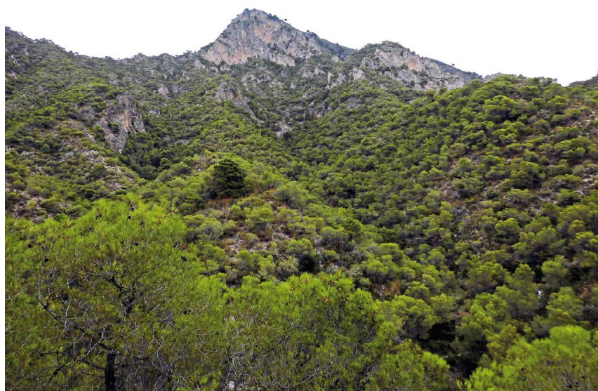
En los primeros compases dominan los densos bosques de pinos carrascos entre los que sobresale un resinerero