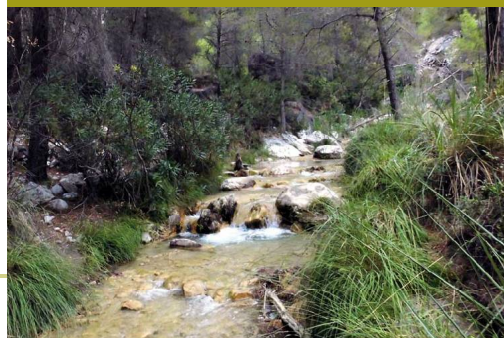
Adelfas, juncos y carrizos en el cauce del Río Chillar con el bonito color albero del fondo rocoso

El Río Chillar es la linde de términos municipales de Nerja (hacia el este) y Frigiliana (hacia el oeste), y se cruza en el km 8 de recorrido aproximadamente. Se trata de un amplio valle en V que en su fondo ha sido excavado por la acción erosiva del río en cahorros y cerradas de escasa altura por lo general pero con tajos de cierta envergadura a distintas altitudes. Las pendientes hacia el río son muy pronunciadas y en el tramo que nos ocupa hay desniveles superiores a los 1.000 metros desde los desafiantes picos y tajos de la Sierra Almijara, sobre todo los relieves orientales. Es relativamente frecuente escuchar el trasiego de los visitantes abajo en el río, si bien no suelen ascender tanto como para llegar hasta el punto de vadeo del GR-249.