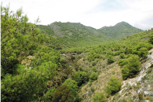
Barranco de la Coladilla y Cerro Verde