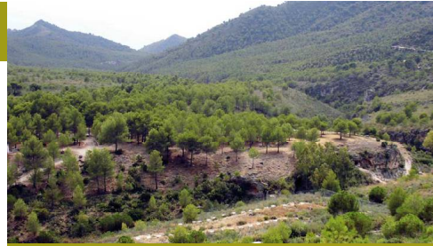
Las instalaciones de medición de la erosión y, al otro lado del Barranco de la Coladilla, el Área Recreativa del Pinarillo

El Mirador del Tramo está en la Loma de las Garzas, último bastión rocoso del trayecto y lugar obligado desde el que hacer una retrospectiva del camino realizado (hacia