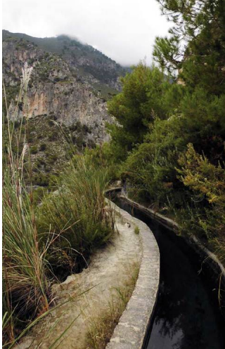
El sendero se dirige hacia el Río Chillar tras cruzar la acequia que nutre a los ingenios hidráulicos de abajo

buenos representantes pese a la sequedad del sustrato, de modo que busca las zonas más umbrías. Y aunque es más difícil de localizar, también hay olivilla ( Cneorum tricoccum ), un raro endemismo costero testigo de climas tropicales y de hábitat muy restringido. Los acompañan palmitos, matagallos, esparteras, lentiscos, enebros, esparragueras, aulagas y algunos algarrobos y coscojas.