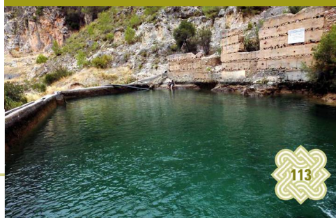
El Pozo Batán, en el cauce del Río Higuierón, de la Comunidad de Regantes de las Acequias de Lizar y el Molino de Frigiliana

Bajo el pinar aclarado de carrascos se localizan al principio buenas poblaciones de espino cambrón ( Maytenus senegalensis ) una especie de arbusto espinoso amenazada y catalogada como vulnerable que gusta de la influencia costera. El boj ( Buxus balearica ) también tiene