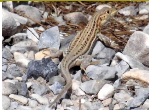
Una lagartija colirroja, típico habitante de los arenales y chinarrales del Parque Natural

Ambos ríos están muy encajonados, lo que aúna umbría y estrechez del cauce, con lo que la arboleda está muy restringida a saos y mimbreras. Las adelfas son las grandes supervivientes a las riadas y sequías, acompañadas de juncos y carrizos. Son muy importantes los travertinos en estos ríos calcáreos, y en ellos, sobre las aguas, medran los culantrillos de pozo y las flores de la viuda o acericos. En las orillas, abundan