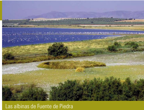
Las albinas de Fuente de Piedra

El paisaje se completa con lagunas menores (el Laguneto, la de las Palomas y la de los Abejarucos), algunos retazos de encinar y