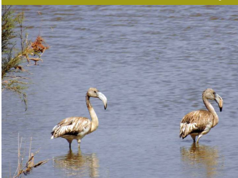
Flamencos inmaduros vadeando la orilla de una laguna