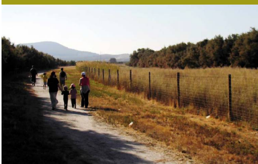
Visitantes del espacio natural protegido caminando por el GR

La Laguna Dulce, la segunda en tamaño del conjunto, está a 450 metros de altura, la cubeta ocupa 78 hectáreas y es circular, con unos 800 metros de diámetro cuando llena. En el extremo opuesto al sendero hay una pequeña zona recreativa y un observatorio ornitológico a los que se puede llegar con facilidad siguiendo la pista que sale hacia el este y luego quiebra hacia poniente. La composición de sus aguas, como sugiere su nombre, es menos salina de lo habitual aquí. Mantiene una buena población de patos buceadores, gaviotas y limícolas. El sendero llega a la zona con vegetación más abundante, tarajes, carrizos y aneas, lo que impide el contacto visual directo con la orilla y la lámina de agua.