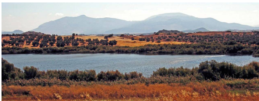
La Laguna Dulce, con los perfiles del Arco Calizo Central detrás

El carril conecta con otro en mejores condiciones que se encamina en dirección oeste hacia el pueblo. Enseguida se bifurca, en las proximidades de una torreta metálica con una veleta, seleccionando la pista de la derecha, que pasa por una granja porcina y llega al punto de destino, Campillos, por la Calle Álamo. ◉