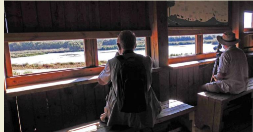
Uno de los observatorios de ave del recinto del centro de visitantes

En el Centro de Visitantes de la Laguna de Fuente de Piedra hay dos senderos habilitados para el conocimiento de la Reserva Natural. Los dos salen de las inmediaciones del Mirador del Cerro del Palo. Uno de ellos, el de Las Albinas, se dirige hacia el norte, hacia el Arroyo de Santillán, pasando por las zonas inundables de su desembocadura. El otro, más corto y además accesible para personas de movilidad reducida, visita los Miradores del Laguneto, de