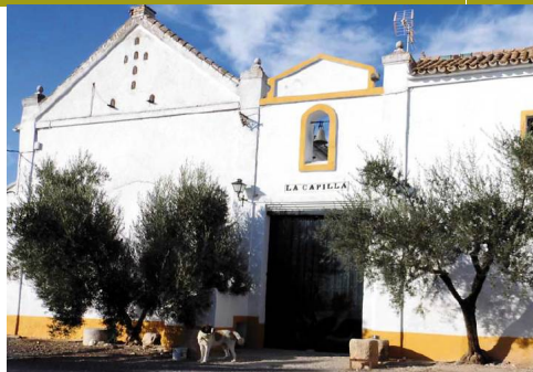
El Cortijo de la Capilla, uno de los primeros caseríos grandes, que el sendero deja a la derecha

Desde el punto de vista medioambiental lo más destacado son las lagunas de la Sarteneja. La primera que se ve es la mayor, enfrente del cortijo. Es muy somera pero con una lámina de agua bastante extensa, lo que permite la visita de fochas, garzas y flamencos. En un cruce inmediato de carriles, hacia la izquierda, hay un acceso entre una casa abandonada y unos setos de hierba de la pampa que llevan hasta el dique de separación de la laguna descrita con otra más profunda que mantiene el agua más tiempo como demuestra el cordón de