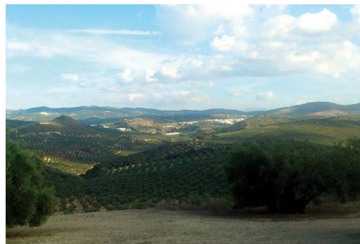
Desde el primer altozano se divisa el pueblo de Villanueva de Algaidas y el valle del Río Burriana

Barranco Hondo resulta ser una rambla a menudo seca donde persisten los tarajes, adaptados a suelos salinos. El camino lo cruza