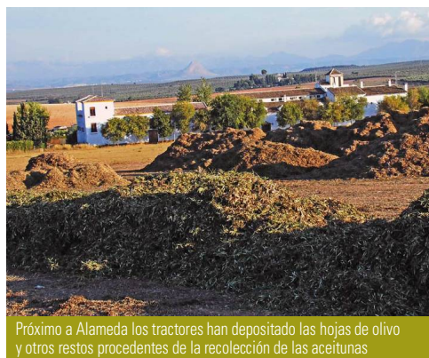
Próximo a Alameda los tractores han depositado las hojas de olivo y otros restos procedentes de la recolección de las aceitunas

El camino sube levemente hasta un cortijete con silos en la zona conocida como Vega Alta y en el kilómetro 16. Justo al lado de la casa ya hay algunos reductos de encinar, como recuerdo de lo que la zona fue. Debido a la alta productividad del terreno, probablemente