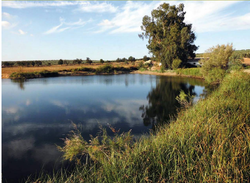
En la Sarteneja, la laguna más honda mantiene el nivel de agua más estable y un cordón de plantas ribereñas

Un poco más adelante, al lado de la autovía, hay otra zona que se encharca, de tamaño intermedio entre las anteriores y menos interesante desde el punto de vista de la vegetación.