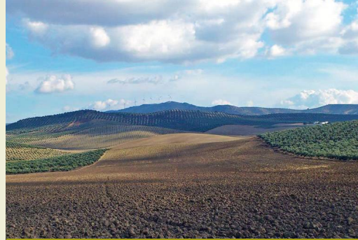
Panorámica de las amplias tierras de labor donde se alternan al principio el secano y el olivar

En cuanto a los caminos tradicionales, desde Cuevas Bajas hasta el Cortijo de Pajariego se