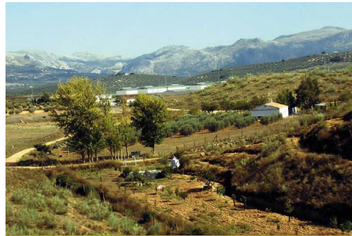
La Saucedilla y el arco calizo central

El terreno se abre bastante, pero siguen acompañando al sendero bosquetes aislados