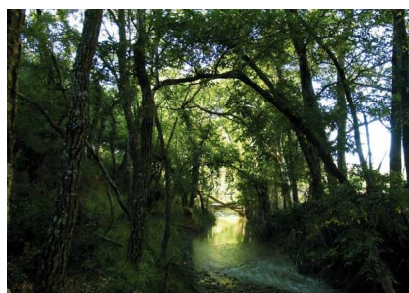
Bosque de ribera del Arroyo Marín