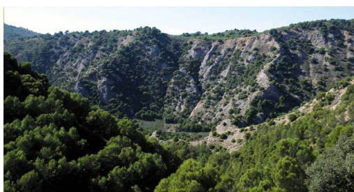
Los pinares sujetan las laderas de yesos y arcillas de la Hoz de Marín

debido a un alto farallón de yesos y margas al que sigue socavando. El PR A-157 continúa un poco hacia abajo, pero el sendero cambia de dirección y sentido y traza una línea paralela al cauce a contracorriente. A la izquierda, fuertes pendientes casi sin árboles asentadas a duras penas por tomillos y retamas. El valle se va abriendo, la vereda se convierte en carril y comienza a subir dejando la hoz atrás. A escasos metros de Archidona, se ven en los taludes algunas alcaparras y berzas silvestres (Género Moricandia ), indicadoras de tierras ricas en arcilla y yeso. ●