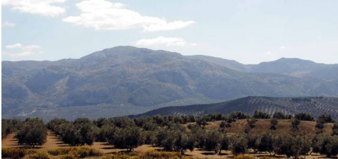
Arco calizo central desde el GR-249