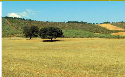
Los campos de labor sustentan todavía algunas encinas mientras que sobre la Loma del Pinar despuntan los pinos

La Hoz del Arroyo de Marín es un paraje tan emblemático que, pese a su reducida extensión de algo más de 600 hectáreas, ha sido declarado por la Diputación de Málaga como Espacio Sobresaliente con Protección Compatible. La vista aérea de la Hoz explica su nombre, una marcada cicatriz semicircular de 250 metros de desnivel medio, interrumpida por su extremo norte. El valle termina en las Huertas del Río, donde el cauce realiza un brusco giro hacia el oeste buscando el Peñón