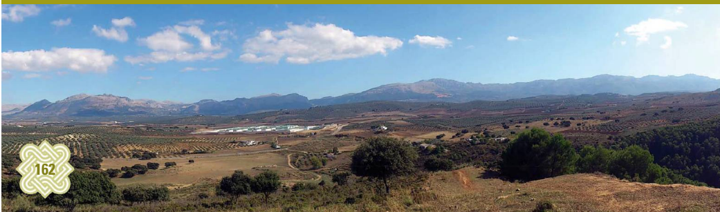
Arco calizo central y Hoz de Marín

provincia recibiendo las aguas del Arco Calizo Central, de la Vega de Antequera y de la Sierra de las Nieves. De la importancia del curso fluvial dan fe sus otros nombres, ya en desuso, el Río Málaga y Guadalquivirejo.