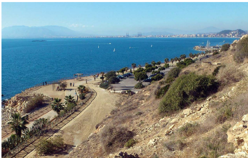
Zona de paseos que utiliza el GR-249 para salvar los primeros acantilados marinos