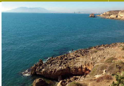
Acantilados de la Araña con el Peñón del Cuervo en segundo término y la Sierra de Mijas detrás

Para llegar al final de la etapa en el Arroyo Totalán hay que transitar otro poco al lado de la carretera donde a las exclusivas poblaciones ibéricas del espino de procedencia norteafricana Maytenus senegalensis se unen el hinojo marino sobre las rocas ( Crithmum maritimum ) y la oruga de mar ( Cakile maritima ) en los arenales. Al frente y al otro lado del Arroyo Totalán, para la siguiente etapa esperan las extensas playas de la Cala del Moral y el Rincón de la Victoria. ○