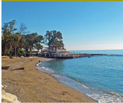
Los Baños del Carmen

denso cañaveral pero un poco más arriba hay alguna arboleda. En la margen derecha de la desembocadura, constreñidos por la N-340, hay unos cuantos farallones calcáreos de color rojizo cuya génesis está a caballo entre el acantilado marino y la cárcava fluvial. Se ha utilizado como escuela de escalada deportiva.