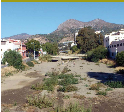
Arroyo Jaboneros y Monte de San Antón

Por último, no está de más saber que la Gran Senda de Málaga transita a veces sobre las canalizaciones de las aguas residuales de esta urbe alargada que resulta ser Málaga. La cercanía de las casas a la costa hace que estos residuos líquidos tengan que ser elevados desde las 26 estaciones de bombeo a las dos principales Estaciones de Depuración de Aguas Residuales, situadas en la margen izquierda del Guadalhorce (muy cerca del comienzo de la etapa) y en el Peñón del Cuervo (km 13.3), aproximadamente un kilómetro tierra adentro por el vallecito del Arroyo del Judío. La gestión integral del agua en Málaga se completa con las Estaciones Potabilizadoras de El Atabal, Limoneros y Pilonos, las principales, que reciben el agua para consumo sobre todo desde los tres pantanos del Chorro, desde el de La Viñuela en la Axarquía y desde el de la Concepción en Marbella.