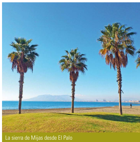
La sierra de Mijas desde El Palo