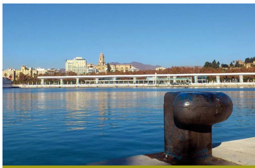
La catedral de Málaga y el nuevo paseo desde el puerto

El principal curso fluvial de la etapa es el Río Guadalmedina, que se cruza apenas comenzada la andadura. Etimológicamente se trata del Río de la Ciudad, y en efecto Málaga se ha construido a ambos lados del mismo, desembocando en la parte occidental del Puerto, prácticamente en el centro urbano. Málaga y su río comparten una historia de desencuentro que ha llegado hasta hoy. Pese a los últimos esfuerzos, todavía no se ha dado con una solución para integrar el cauce en la moderna ciudad aunando uso público y conservación.