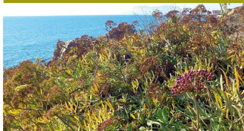
Hinojo de mar ( Crithmum maritimum ) creciendo sobre el acantilado marino