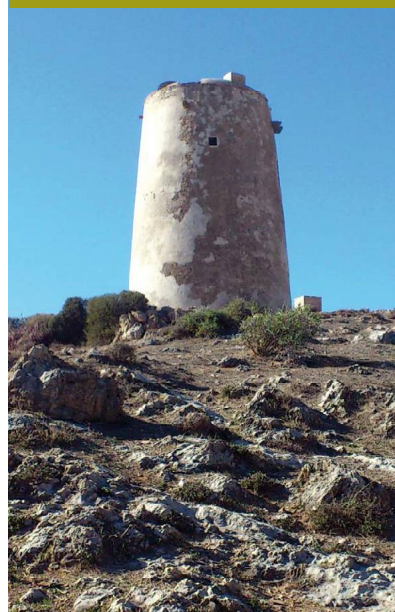
Flanco oriental de la Torre Atalaya de las Palomas

En cualquier caso, para imaginarse la potencialidad de este lugar hay que retrotraerse a épocas pretéritas en los que el nivel del mar era decenas de metros más alto que el actual, propiciando praderas y bosques litorales que complementarían con