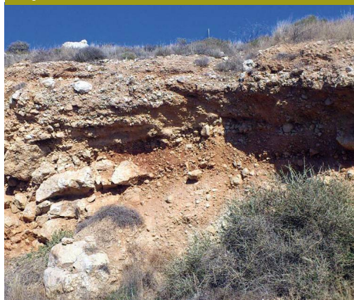
El talud del antiguo ferrocarril suburbano permite ver el conglomerado del acantilado

Justo antes del comienzo del Paseo Marítimo del Pedregal (el sendero hace un quiebro para llegar a la playa y lo deja a la derecha) están el antiguo varadero, los talleres centenarios, el Museo y la Escuela Taller. La Consejería de Cultura declaró en 2008 la Carpintería de Ribera de las Playas de Pedregalejo como Bien de Catalogación General para el Patrimonio Histórico Andaluz. Una de sus estrellas es la construcción de las barcas de jábega, las embarcaciones de pesca tradicionales cuya forma y decoración hace pensar en su origen fenicio y que aún pueden verse navegando por estas costas del levante malagueño.