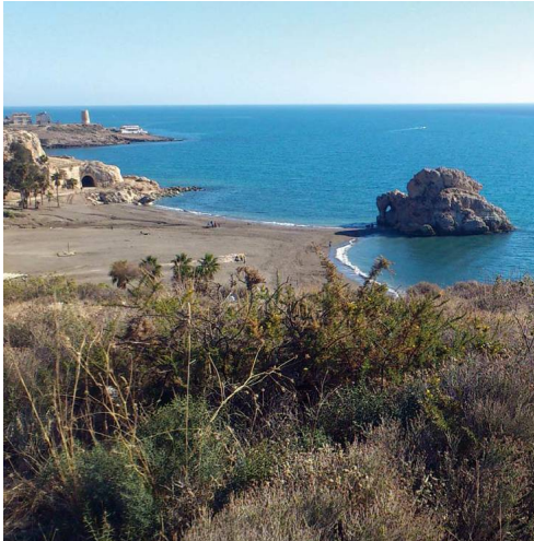
La Playa del Peñón del Cuervo con el espigón rocoso que le da nombre dividiéndola en dos

de la Araña pone entonces el contrapunto a tan sugerente enclave con sus torres metálicas y el polvo resultante de la molienda de la caliza posándose por doquier, un tributo a pagar por la producción de este material de construcción tan demandado a comienzos de siglo en la Costa del Sol.