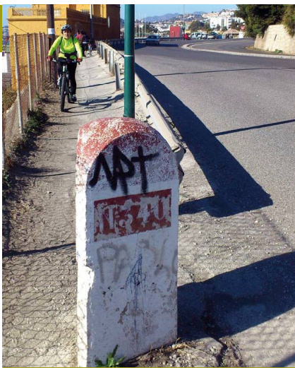
Mojón en la carretera N-340

En el Palmeral de las Sorpresas del Muelle 2 tiene sus instalaciones el Aula del Mar, que inició su andadura en 1.989 en dependencias cedidas por la Cofradía de Pescadores. Es ya una institución en el litoral andaluz por sus actividades relacionadas con la Educación Ambiental, la conservación de los ecosistemas litorales y la recuperación de especies marinas, especialmente tortugas y cetáceos. Actualmente gestionan el Museo Alboranía, una visita muy recomendable.