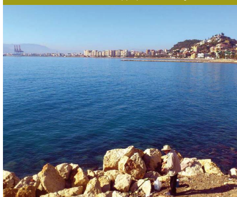
Pescador en los Baños del Carmen y playas de la Malagueta detrás

El Arroyo Toquero desemboca en la Caleta y es apenas perceptible por el senderista. Luego se pasa por el Arroyo Jaboneros, que viene de