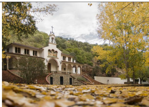
Molino de la Molineta