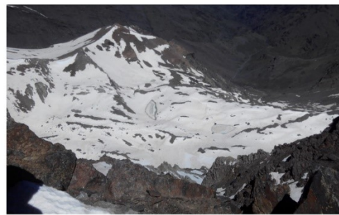
Alud en el corral del Veleta y laguna de la Mosca 15 -5-19