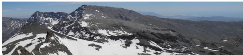
Cara sur zona de cumbres 14-5- 9