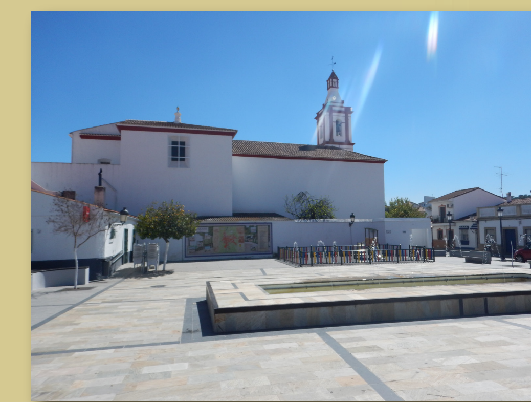
Plaza de la Constitución