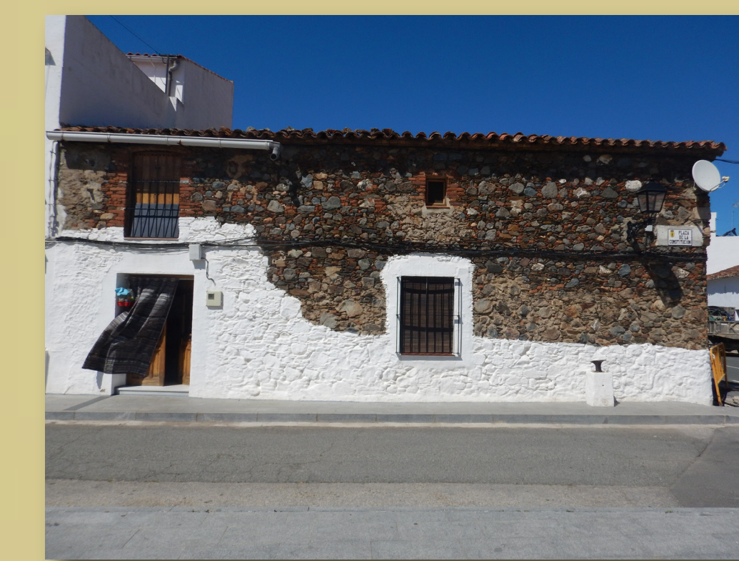
Venta el Ronco