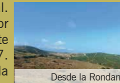
Desde la Rondana

El sendero se inicia en el Camino del Tesorillo desde el Cementerio Municipal. El recorrido se realiza fundamentalmente por pistas o carriles. Se inicia por carril con fuerte pendiente asfaltada hasta el arroyo de la Peñuela, luego fuerte pendiente hasta el Puerto de la Teja, cruzando en la subida un túnel de la AP-7. Una bajada intensa nos deja en el Arroyo de la Sierra, luego comenzaremos la subida hacia las casas de la Rondana, otro de los puertecillos del camino, seguimos por la pista en sentido descendente, la pista va girando hacia el sur y se coloca ya en los altos de la loma, desde donde se puede ver el embalse del arroyo del Cautivo (embalse de Pajaritos). El recorrido nos lleva hasta un paso canadiense que deja atrás las zonas de cultivo para dar paso a matorral de monte bajo donde predomina el lentisco y el palmito. Ahora vemos a nuestra derecha el Valle del Guadiaro, al frente podemos ver el pinar de Tábanos punto final del recorrido, que podemos ampliar tomando la ruta del pinar.