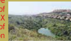
Embalse de Alcorrín.

The trail starts at the northwest end of the Princesa Kristina urbanization in an unfinished road. The road soon becomes track terriza that advances by the road of the Loma de Miraflores, between Mediterranean scrub (the views of the coast, Manilva, Sierra Bermeja and Crestellina, Casares and the axe of Gaucín are unbeatable) to turn south on kilometre 1.1. We cross the stream of the Alcorrín with dry channel in summer and reached this point the path surrounds the Hill of the Castillejos of Alcorrín. Once surrounded, there is a narrow slope that allows us to cross the stream again (5.3 km) to turn southwest in the direction of the urbanization from which we have left. This trail offers a beautiful view of the Alcorrín Dam, which dates from the XIX century, ordered to build on the initiative of the Larios family, introduction connection with the cultivation of sugar cane.