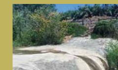
Manantial la Peñuela

The trail has two options, a 3 km route visiting the best known public fountains of Manilva and the 5 km. long route extending the previous one with very good views. It begins in the Plaza de la Vendimia, continues through streets Utopia and Muro Aguilar until reaching the parish church of Santa Ana, looking for the exit of the urban area. It crosses the A-377 road and continues down to Arroyo de la Peñuela, a meeting point for many Manilveñas women until some years ago. At this point the path continues to the right. After passing by the Fountain of the Peñuela. Turning left goes back to the Loma del Pinto. Continue along the ridge between vineyards, with panoramic views. Soon we reach the small building that protects the Fuente de la Ocasión. The road continues parallel to the stream for a walk of poplars, white poplars, willows, pines, cork oaks... and arrives at the rustic park la Peñuela.