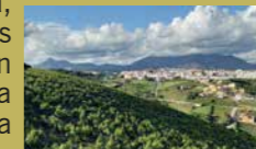
Manilva desde los viñedos

El sendero tiene dos opciones, una ruta de 3 km visitando las fuentes públicas más conocidas de Manilva y la ruta larga de 5 km que amplía la anterior con muy buenas vistas. Comienza en la Plaza de la Vendimia, continua por calles Utopía y Muro Aguilar hasta llegar a la Iglesia parroquial de Santa Ana, buscando la salida del casco urbano. Cruza la carretera A-377 y sigue bajando hasta el Arroyo de la Peñuela, centro de reunión de muchas mujeres Manilveñas hasta hace algunos años. En este punto el sendero continua hacia la derecha. Tras pasar por la Fuente de la Peñuela. Girando a la izquierda se remonta la Loma del Pinto. Continuar por la cresta entre viñedos, con vistas panorámicas. Pronto llegamos a la pequeña edificación que protege la Fuente de la Ocasión. El camino continua paralelo al arroyo por un paseo de chopos, álamos blancos, sauces, pinos, alcornoques,... y llega al Parque Rústico La Peñuela.