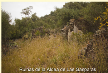
Ruinas de la Aldea de Las Gasparas