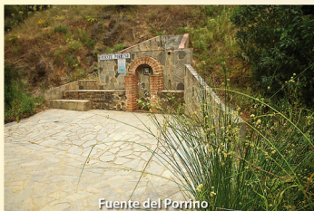
Fuente del Pomino