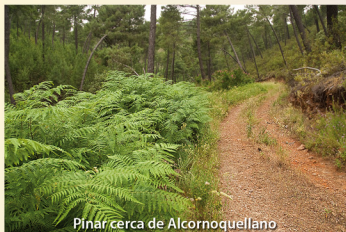
Pinar cerca de Alcornoquellano