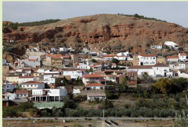
Cuevas de los Camarines