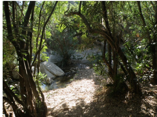
WPT4. Vados del río Manilva