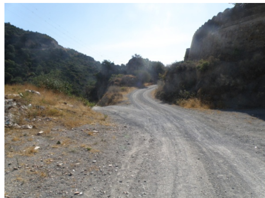
WPT6. Enlace con PR-A 163