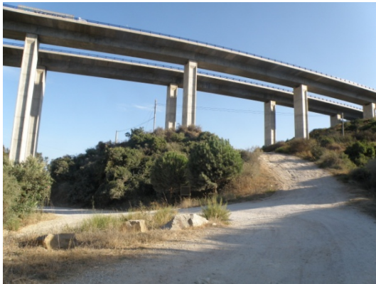
WPT3. Fin de coincidencia con carretera