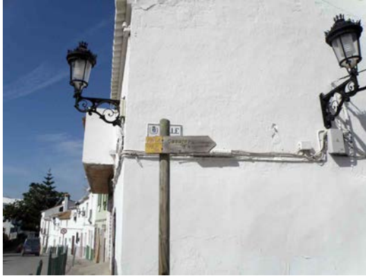
WPT1. Inicio de sendero