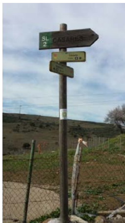
WPT5. Inicio de coincidencia con GR 249 Etapa 29