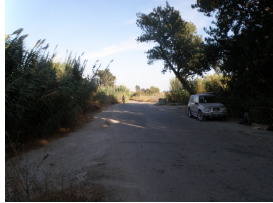
WPT2. Inicio de coincidencia con carretera