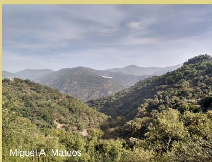
Miguel A. Mateos

El sendero permite conocer la casi totalidad de los montes públicos de Benarrabá, situados al sur del casco urbano y ocupados por un muy bien conservado alcornocal con quejigos. El perfil en dientes de sierra resulta de lo sumamente accidentado