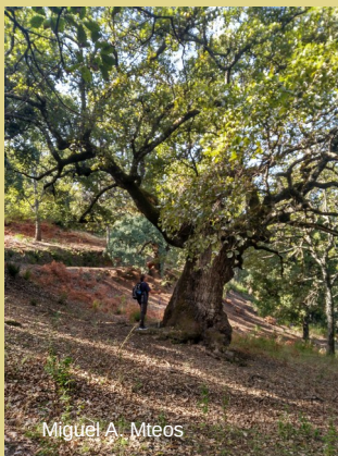
Miguel A. Mteos

There is a notable difference between south and north-facing slopes, with the undergrowth predominantly of Cistus and heather respectively. It is in the depths of the valley that nature is at its most exuberant, with Algerian oak (Quercus canariensis) forests and an undergrowth of broadleaf plants where the diversity of ferns and some rare Mediterranean species (only found in this area) is exceptional.