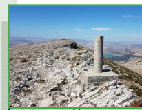
Vértice pico Huma