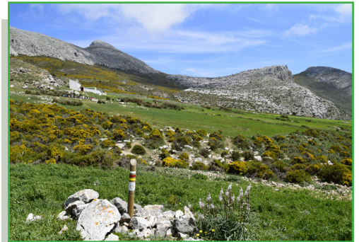
Cortijo de la Rejonada y pico Capilla, al fondo.

Otro factor que se ha tenido en cuenta es preservar y no dañar el hábitat de las fauna que existe en la zona; en los trabajos de campo previos a este proyecto hemos observado la existencia de nidos de buitres y zona de pasto. Por este motivo hemos trazado el sendero para evitar molestar a las especies allí presente y no invadir su entorno.