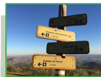
Señales del Sendero