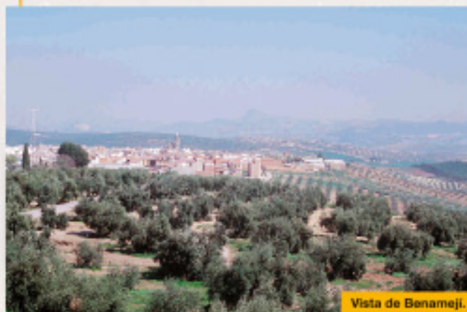
Vista de Benamejí.

Continuamos descendiendo en dirección a la casilla de la Barca, junto al puente que deberemos cruzar. Este rincón nos sorprende por el colorido de su entorno: adelfas, juncos, Cañizo, chumberas, huertas, y algunas aves acuáticas.. A continuación comenzamos el ascenso al pueblo de Palenciana.