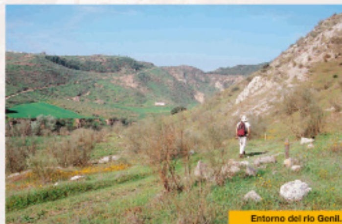
Entorno del río Genil.