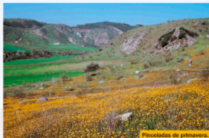
Pinceladas de primavera.