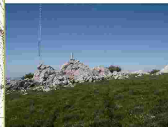
Pico de Vilo