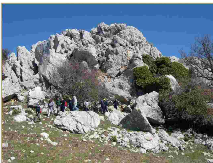
Hiedra debajo del Pico del Vilo.

Una característica importante en los recorridos es su accesibilidad desde el mismo Alfarnate y su trazado que permite combinar senderos realizando itinerarios con mayor dureza. Destacar también la posibilidad de realizarlos a caballo y en bicicleta de montaña en el caso del sendero de las Pilas.