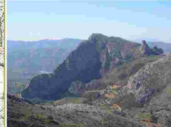
Vista Navazo y Tajo del Fraile