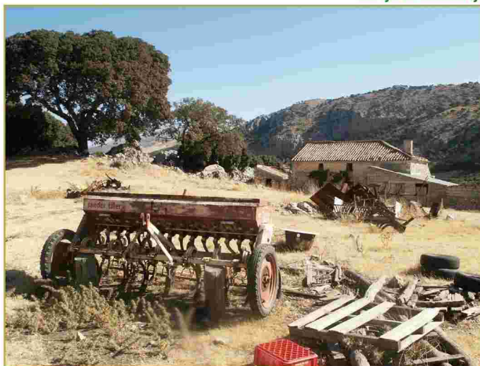
Cortijo de Gastarreja

Una característica importante en los recorridos es su accesibilidad desde el mismo Alfarnate y su trazado que permite combinar senderos realizando itinerarios con mayor dureza. Destacar también la posibilidad de realizarlos a caballo y en bicicleta de montaña en el caso del sendero de las Pilas.