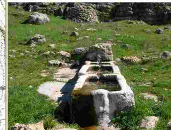
Pilas de Barrionuevo