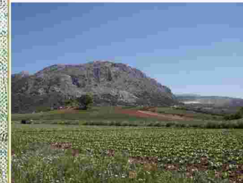
Vistas de los Tajos de la Palomera