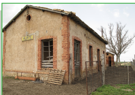
Estación de Hijate

Calculado según criterios M.I.D.E. para un excursionista medio, poco cargado.