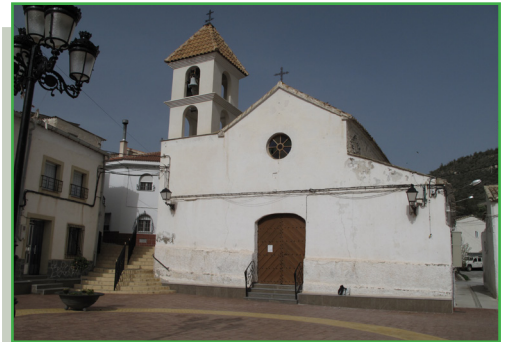
Ntra. Sra. Virgen del Rosario

Sentido Alcóntar - Hijate: Iniciamos nuestro itinerario bajando hacia el río Almanzora dirección Rambla de la Amarguilla, por un paraje natural, en el entorno de la cuenca del alto Almanzora (donde nace el rio). En este tramo enlazaremos con el PR-A 12 durante poco más de un kilómetro. Continuaremos por la Amarguilla hasta el km 5 donde un camino en ascenso nos conducirá a la Loma de En medio, límite del parque natural y provincial entre Almería y Granada. A partir de este momento podremos disfrutar de unas maravillosas vistas en el Paraje de los Rincones, desde donde podremos divisar a nuestra izquierda el Parque Natural de la Sierra de Baza y a nuestra derecha el contraste de los llanos de prados verdes y ocres, además de la población de Hijate hacia donde nos dirigimos. Dejaremos a nuestra izquierda la Estación de Hijate para conectar con la vía verde durante un kilómetro y medio, la cual abandonaremos para conectar con el PR- A 72 que tras pasar por la barriada del Pilancón nos conducirá a nuestro punto de destino, la localidad de Hijate, principal pedanía de Alcontar.