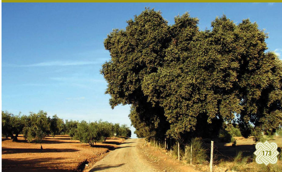
Olivares y encinares rodean la Gran Senda

Villanueva de Tapia. Lo blando de las arcillas sobre las que se crían los olivares del pueblo ha hecho que las arroyadas descontroladas marquen una profunda cicatriz en ellas, que se han intentado parar y reparar con medios de fortuna. Todavía hay algún chopo o álamo, pero lo habitual son las zarzas en los terrosos taludes. Cerca del pueblo está la Fuente de la Alameda, pero quizá el topónimo más curioso sea el de la Fuente de Allalantes, que se deja a la derecha para llegar al final del tramo.