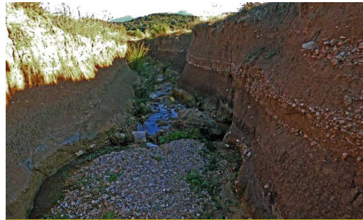
La cárcava provocada por este arroyo permite obtener un corte del suelo del olivar, con estratos de diferente granulometría

La zona más alta está copada por olivares y almendrales muy cuidados, pero aparecen por todos lados excelentes y añosos ejemplares de