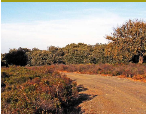
Hacia la mitad del recorrido las dehesas de encinas con jaguarzo morisco son las que predominan a los lados del sendero

Nada más pasar debajo de la autovía (km 6.5) se coge la Realenga del Puerto, que es la que va pegada a la carretera. A la espalda se deja el Cerro del Umbral, tan despejado como los anteriores, y se entra en el territorio adhesionado mejor conservado de la etapa. La dehesa de encinas es un agrosistema de carácter forestal también, que aquí es además cinegético. Para compatibilizar aún más ambas facetas, en los campos de al lado se ven trozos de monte con un matorral muy denso de jaguarzo negro junto a otros roturados en los que se han llegado a poner olivos.