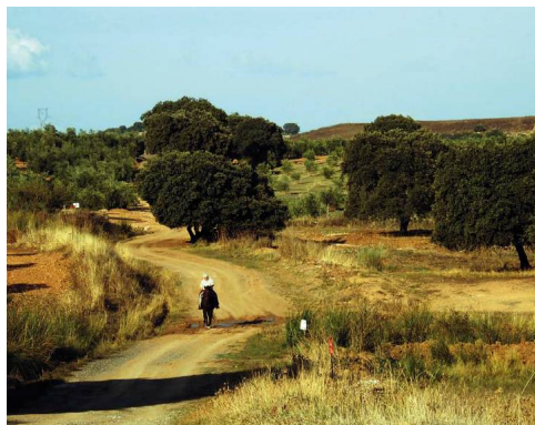
El camino tradicional es utilizado por numerosos caminantes, ciclistas y jinetes que campean por las suaves dehesas

Por último, el descenso más largo del día lleva a cruzar el Arroyo de la Cerca al lado de