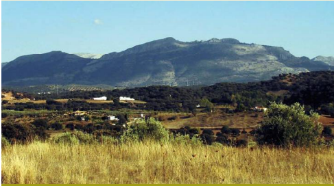
La etapa permite desde algunos de sus altozanos contemplar de nuevo las grises cresterías y bosques de las etapas anteriores