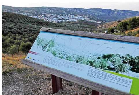
Cartel panorámico en el Mirador de las Palomeras

El pueblo fue la primera de las Villas Nuevas en independizarse de Archidona, y serían tales los pleitos que adquirió el sobrenombre de El Entredicho hasta que se concedió la tutela al Licenciado Pedro de Tapia, que le prestó su apellido. ○