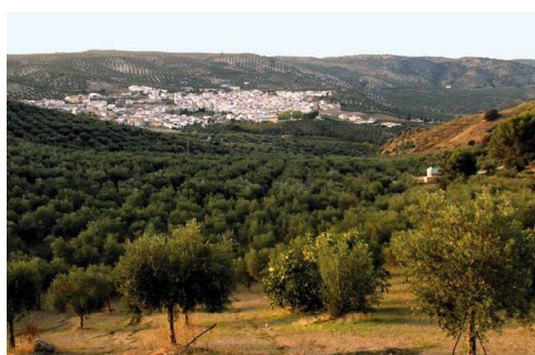
Villanueva de Tapia, entre olivos, desde el altozano final de la etapa