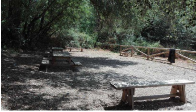
Foto - GR 249. Etapa 15: Variante 249.2 Cuevas de San Marcos - Cuevas Bajas