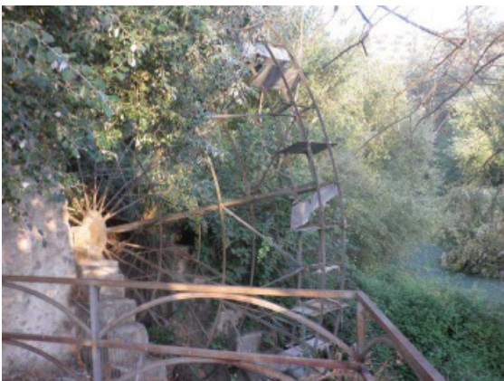
Foto - GR 249. Etapa 15: Variante 249.2 Cuevas de San Marcos - Cuevas Bajas