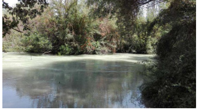
Foto - GR 249. Etapa 15: Variante 249.2 Cuevas de San Marcos - Cuevas Bajas