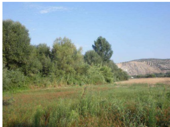
Foto - GR 249. Etapa 15: Variante 249.2 Cuevas de San Marcos - Cuevas Bajas