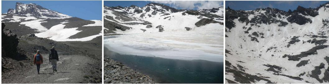
Veleta, laguna de las Yeguas y Tajos de la Virgen 28-5-14