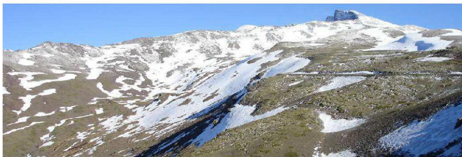
Veleta cara Norte y cara Sur 21-5-14