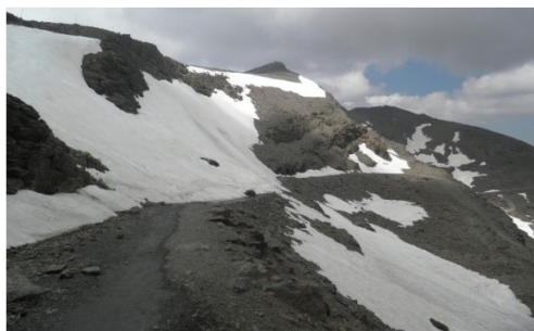
Collado de La Carhuela 18-6-19