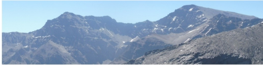
Cara norte Alcazaba y Mulhacén 18-6-19