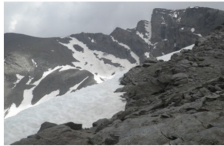
Corral del Veleta 18-6-19