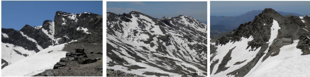
Corral del Veleta, Tajos de la Virgen y Canhueta del Veleta 4-6-19