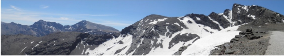
Vertiente norte y sur 5-6-19