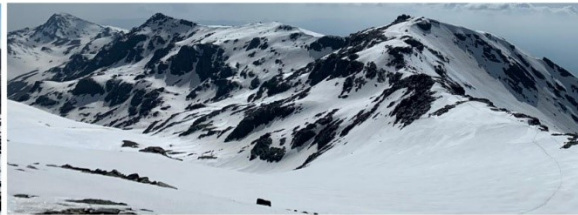
Alcazaba, Mulhacén, tajos de La Virgen y Caballo 8-5-9