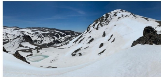
Cartujo y laguna y cerro del caballo 8-5-19 -19