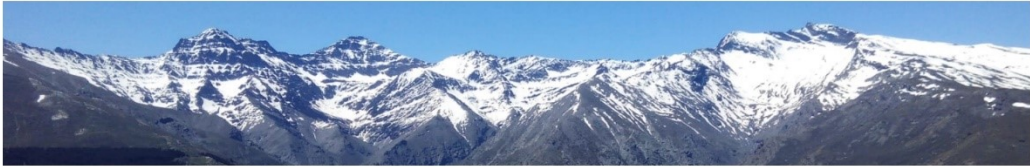
Desde la alcazaba al Cartujo 8-5-19