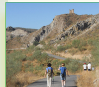
Castillo de Gómez Arias