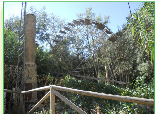
Noria árabe Huerta de las Cruces, Río Genil