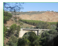
Puente Hernán Ruiz