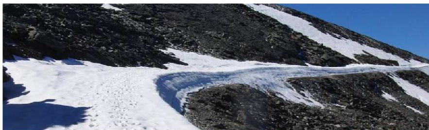
Carretera a partir de las Posiciones del Veleta 2-6-15