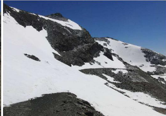
Corral del Veleta y Carihuela 2-6-15