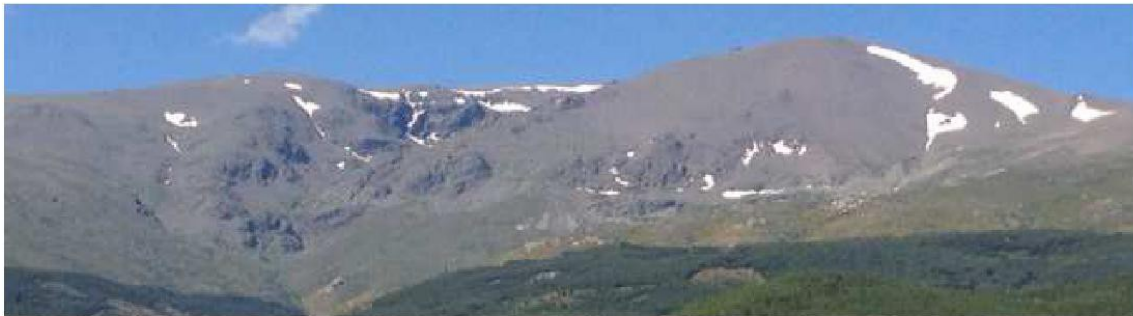
Picón de Jérez 2-6-15