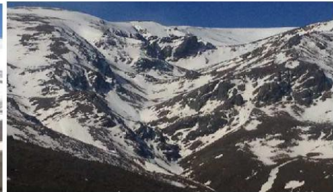
Picón de Jerez y cabecera río Alhorrí 30-3-15