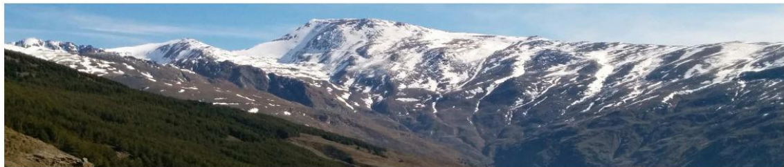
Cara sur Mulhacén 31-3-15