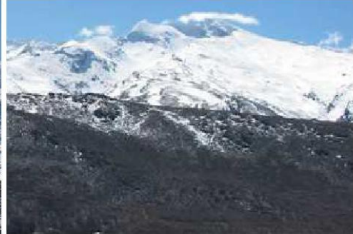
Vertiente norte Alcazaba, Mulhacén y Veleta 29-3-15